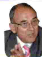
JUAN J. RODRÍGUEZ, sec. gen. de la OMC

"¿Priman siempre los intereses humanos y globales a los económicos?"