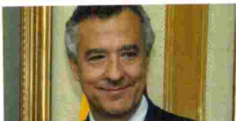
(2006) FERNANDO PUIG DE LA BELLACASA , subsecretario del Ministerio de Sanidad y Consumo

“La Administración debe superar el papel de mero gestor de recursos y asumir una función más dinámica y participativa”