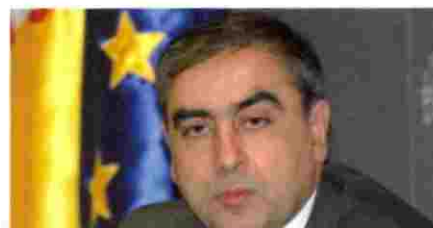
(2010) JOSÉ MARTÍNEZ OLMOS , secretario general de Sanidad

“La prevención es la clave para la mejora la salud de la población en el futuro”