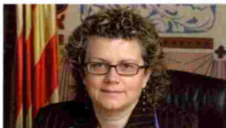
(2008) MARINA GELI , consellera de Salut de la Generalitat de Catalunya

“Lograr el equilibrio entre necesidades y recursos es básico para la sostenibilidad del sistema”