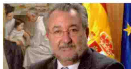
(2009) BERNAT SORIA , ministro de Sanidad y Consumo

“La sanidad privada no puede sustituir a la pública”